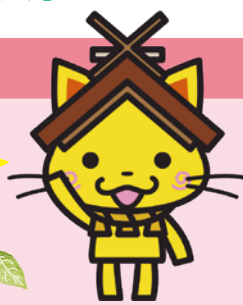
島根県観光キャラクター 島観連許諾第7726号